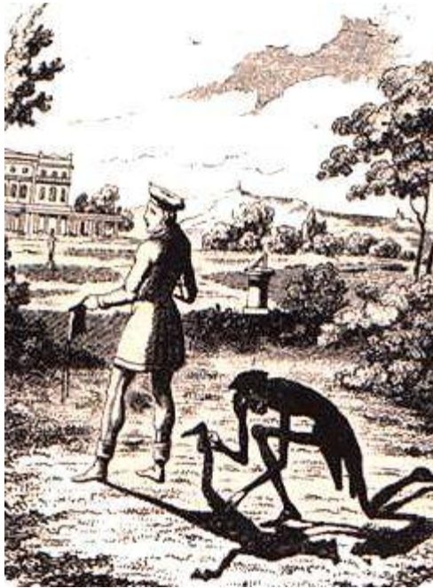
Petri Iacturarii mira historia; Hanc picturam rasilem confecit G. Cruikshank, a.1827.