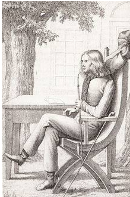
Chamisso pipam fumans.

A.1801 factus est succenturio; ipsum se vocavit Ludovicum de Chamisso .