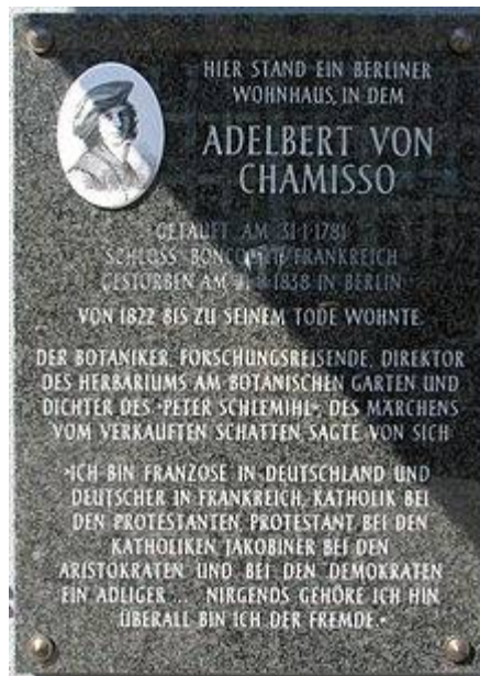
Tabula memorialis ad domum 235 iuxta Viam Friedericianam in tribu Berlin-Kreuzberg statuta.

Insula quaedam in parte Freti Beringiani 8 boreali sita tempore Expeditionis Ruricianae appellata est secundum nomen Chamissonis. In honorem eiusdem etiam nuncupata sunt genera botanica Chamissoa H.B.K., quae spectat ad familiam Amaranthacearum, Chamissonia Endl. (familia Oenotheracearum), Chamissoniophila Brand (familia Boragina-cearum, hodie synonymum Antiphyti DC. ex Meisn.). Praetera plura 150 species plantarum necnon nonnullae species animalium in honorem Adelberti de Chamisso sunt denominatae.