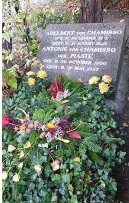
Sepulchrum Adelberti de Chamisso

Chamisso cancro pulmonum affectus mortuus est d.21. m.Aug. a.1838 Berolino in urbe. Sepulchrum honestum urbis Berolinensis ei attributum situm est in coemeterio III communitatis Berlin-Kreuzberg in divisione 3/1, paucis metris a sepulchro Ernesti Theodori Amadei Hoffmann. In propinquo sita est Platea Chamissonis . D.31. m.Ian. a.2006 ad domum 235 iuxta Viam Fridericianam sitam, ubi usque ad a.1908 sita erat domus Chamissonis, revelata est tabula memorialis Chamissoni dedicata.