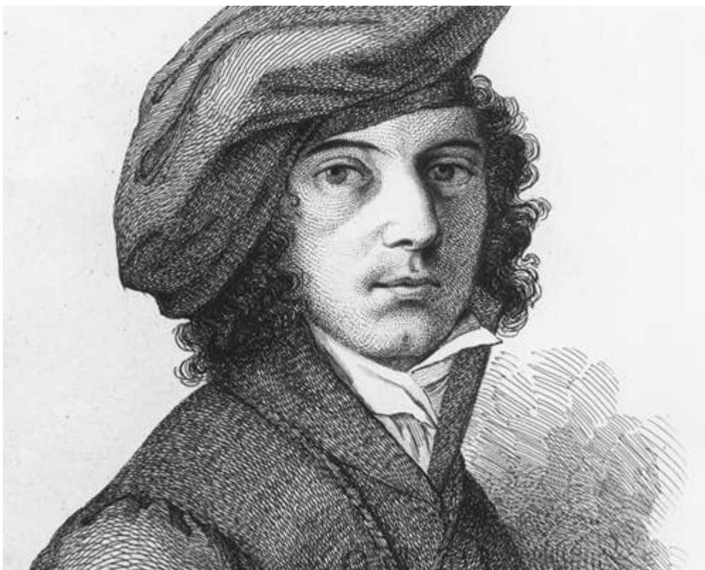
Adelbert de Chamisso (1781-1838). Delineavit E.T.A Hoffmann (1776-1822).