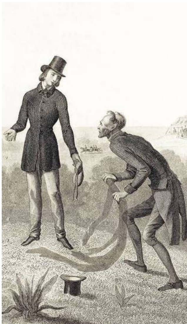
Ecce commercium diabolicum: Petrus vendit umbram. Siderographia circa annum 1900 confecta.

Ille conticuit, at ego magno animi motu perturbatus sum. Quid cogitarem de miro proposito, quo ille emere voluit umbram meam? »Certê mente captus est« cogitavi et voce mutatâ respondi: