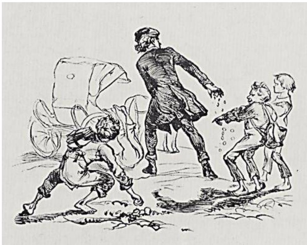
Petrus nummos aureos intêricit pueris insectantibus. A.1839 delineavit Adolfus de Menzel.

Cum tandem resipuissem, properê hoc oppidum relîqui, ubi mihi nihil iam agendum fore sperabam. Primo sacculos meos auro complevi, deinde bursam de collo suspensam ad pectus occultavi. Viridarium pervasi non respectus, viam ruralem attigi versus urbem profecturus. Cum prodirem versus portam, audivi aliquem post me clamantem »Domine iuvenis! Heus Domine iuvenis! Audi, quaeso!« Me converti, mulier quaedam vetula post me clamavit: »Vide, ut caveas, umbram perdidisti«. »Gratias tibi ago, matercula!« Eidem obieci nummum aureum pro consilio benevolê dato arboresque subii.