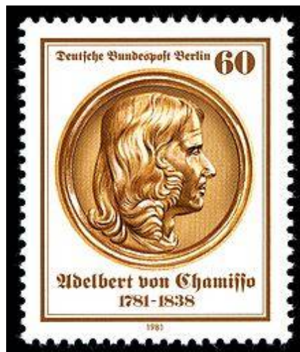
Pittacium epistulare a.1981 in Chamissonis diem natalem ducentesimum a Germaniae cursu publico foederali divulgatum