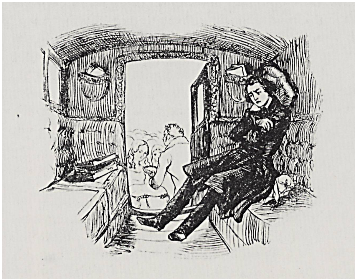
Ecce Petrus lacturarius umbrae expers desperatus in raedâ sedens. Hanc xylographiam confecit Adolfus de Menzel a.1839.

Scriptis Adelbertus de Chamisso, Latine reddidit Nicolaus Groß